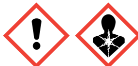
GHS07 Attenzione GHS08